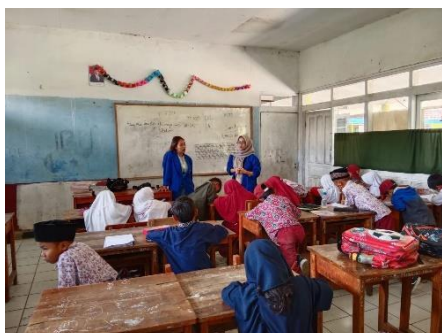
Gambar 4. Pelaksanaan Kegiatan Bijak Menabung Sejak Dini

Kegiatan edukasi finansial dengan tema “Bijak Menabung Sejak Dini”, difokuskan kepada siswa/i SDN Srikandi dengan memberikan pemahaman tentang pentingnya menabung dan pengelolaan keuangan. Edukasi ini dilakukan dengan sosialisasi dan permainan edukatif untuk menarik minat dari anak-anak. Pelaksanaan kegiatan ini berhasil menarik siswa/i untuk mulai belajar menabung. Para siswa memahami konsep menabung dan bagaimana cara mengelola uang saku yang diberikan kepada mereka.