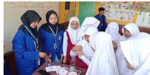
Gambar 5. Simulasi Menabung

Kegiatan simulasi adalah pendekatan pembelajaran yang melibatkan penggambaran atau rekonstruksi situasi dunia nyata untuk memungkinkan peserta berlatih keterampilan dalam konteks yang dikendalikan. Simulasi menyediakan lingkungan yang aman untuk eksperimen dan pengembangan keterampilan praktis, serta meningkatkan pemahaman dan kesiapan peserta dalam menghadapi situasi nyata (Harris dan McDonald, 2019).