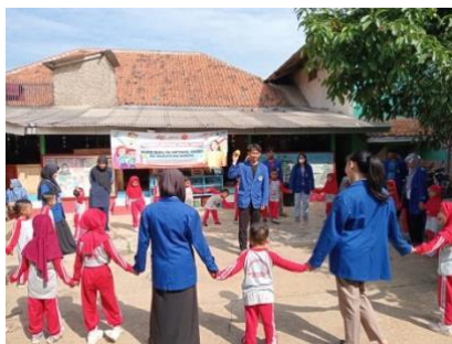
Gambar 3. Edukasi Menabung Melalui Cerpen & Nyanyian

Berdasarkan hasil evaluasi kepada siswa dan orang tua, setelah 6 hari dari kegiatan edukasi, menabung merupakan kegiatan yang menyenangkan saat siswa sudah mengetahui tujuan dari hasil uang tabungan tersebut.