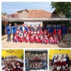
Gambar 7. Pemberian Hadiah Celengan

Kegiatan pemberian hadiah adalah proses memberikan insentif atau penghargaan kepada individu sebagai bentuk apresiasi atau motivasi. Pemberian hadiah dapat mempengaruhi motivasi dan perilaku dengan menyediakan pengakuan eksternal yang berfungsi untuk memperkuat pencapaian atau usaha tertentu, tergantung pada jenis dan konteks hadiah tersebut (Deci, Koestner, dan Ryan, 2018).