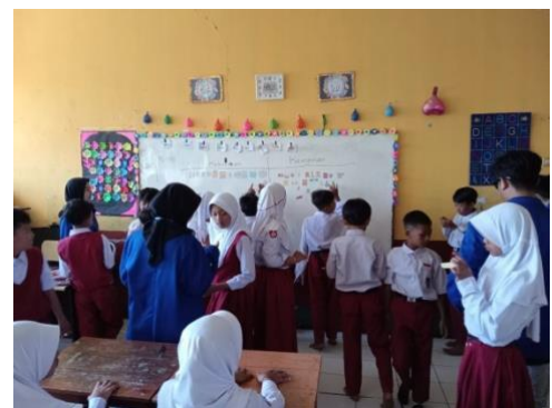
Gambar 6. Simulasi Membedakan Kebutuhan & Keinginan

Membagikan uang kertas mainan untuk dituliskan tujuan dari menabung dan melakukan simulasi menabung dengan memasukkan kertas tersebut ke botol bekas sebagai pengganti celengan. Tujuan menabung dari anak-anak cukup bervariasi dan menunjukkan meningkatnya minat mereka dalam menabung.