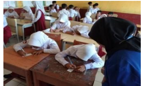
Gambar 4. Kegiatan Menulis Tujuan Menabung