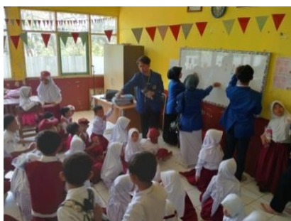
Gambar 2. Edukasi Menabung Melalui Penjelasan Materi

Kegiatan edukasi adalah proses yang dirancang untuk mengembangkan pengetahuan dan keterampilan peserta melalui berbagai metode pembelajaran. Edukasi mencakup berbagai teknik interaktif yang bertujuan meningkatkan pemahaman dan keterampilan peserta didik dengan menekankan pada keterlibatan aktif dan kolaboratif (Barkley, Cross, dan Major, 2018).