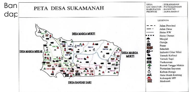
Gambar 2. Peta Lokasi Pengabdian Masyarakat

Lokasi pengabdian Masyarakat ini dilakukan di Desa Sukamanah tepatnya di Kampung Babakan Cianjur RW 09 Kecamatan Pangalengan Kabupaten