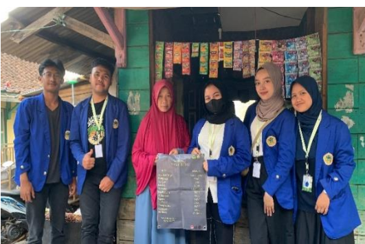
Gambar 8. Penyerahan Daftar Menu Warung Mama Debay

Berdasarkan hasil kegiatan Program Kerja Digitalisasi UMKM, pendampingan dan rebranding UMKM di Babakan Cianjur, Desa Sukamanah, yang dilakukan kepada beberapa UMKM yaitu Azkia Snack, Warung Barokah, Warung Mama Debay, The Panteras diharapkan dapat memberikan dampak positif yang signifikan terhadap pertumbuhan usaha kecil dan menengah di daerah tersebut. Kegiatan tersebut telah dilaksanakan dari mulai observasi sampai