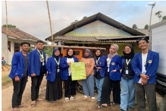
Gambar 6. Penyerahan Daftar Menu Warung Barokah