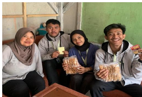
Gambar 3. Kunjungan UMKM

Snack, Warung Barokah, Warung Mama Debay, dan The Panteras.