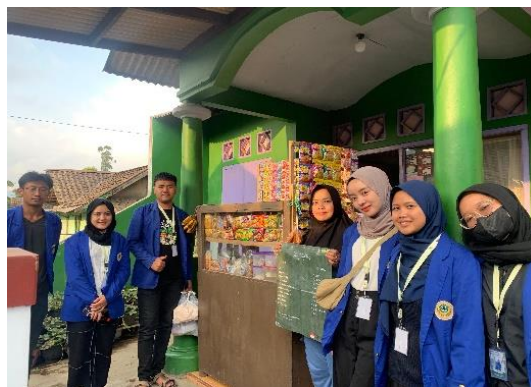
Gambar 7. Penyerahan Daftar Menu Warung The Panteras