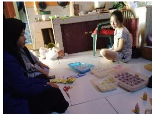
Gambar (1)(2) dan (3) Survey pelaku UMKM

(2) pelatihan yang diisi dengan penyampaian materi mengenai digitalisasi UMKM dan diskusi terhadap materi yang telah disampaikan.