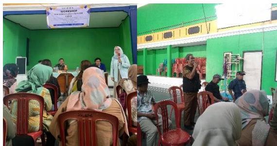
Gambar (4) dan (5), Workshop dan sesi diskusi

(2) pelatihan yang diisi dengan penyampaian materi mengenai digitalisasi UMKM dan diskusi terhadap materi yang telah disampaikan.