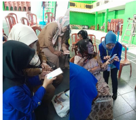
Gambar (6) dan (7) Pendampingan pembuatan akun Google My Business

(3) pendampingan oleh tim mahasiswa dalam pembuatan email business dan akun google my business.