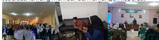
Gambar 1. Kegiatan Wawancara dan Sosialisasi Koperasi

Metode penelitian yang penulis gunakan dengan pendekatan kualitatif dengan metode studi kasus, yang berfokus di Desa Ciwidey. Pendekatan ini memungkinkan analisis mendalam mengenai implementasi koperasi di konteks lokal. Dengan Teknik pengumpulan data menggunakan survey dan kuesioner untuk mengumpulkan data awal tentang kebutuhan dan potensi lokal dari Masyarakat, wawancara dilakukan dengan salah satu Ketua RW di Desa Ciwidey yang ikut menjadi anggota koperasi di beberapa koperasi, serta Diskusi Kelompok Terfokus dengan mengumpulkan pendapat dan ide dari peserta Masyarakat sosialisasi tentang manfaat dan tantangan koperasi.